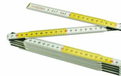
Metro a stecca