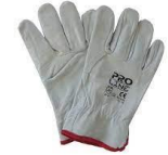
Guanti da lavoro